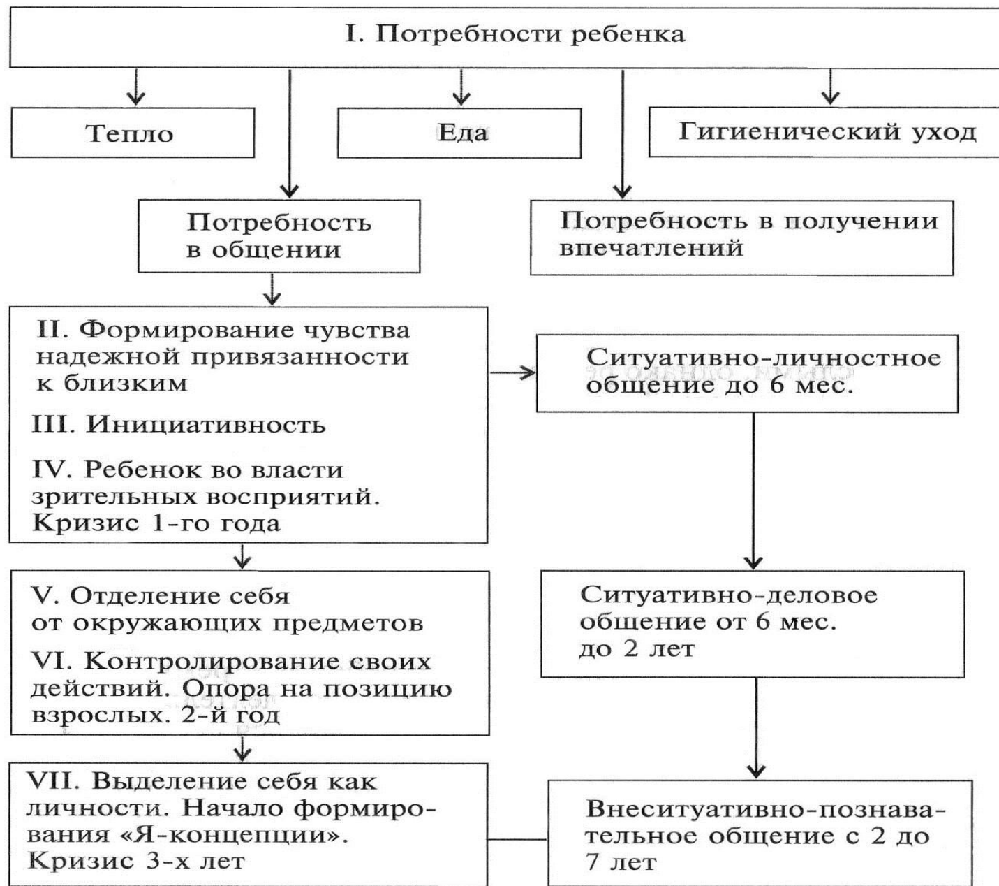
Рис. 15. Этапы становления личности ребенка раннего возраста